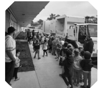
Education at Farallones View Elementary School

Pails are funded by a Department of Resources Recycling and Recovery (CalRecycle) $75,000 grant awarded to MWSD, and utilized by our provider Recology for education and outreach.