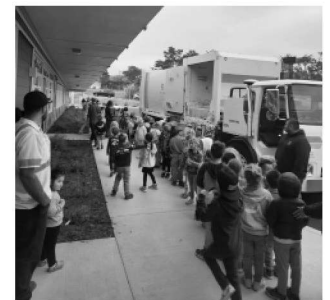
Concienciación en Farallones View Elementary School

El Departamento de Reciclaje y Recuperación de Recursos (CalRecycle) financia los cubos con una subvención de $75,000 concedida al MWSD y que Recology, nuestro proveedor, aprovecha para la concienciación y la divulgación.